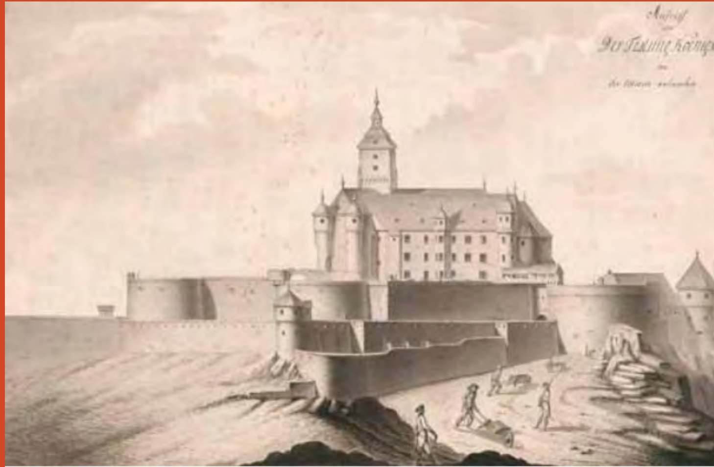
Festung Königstein, 1791/92