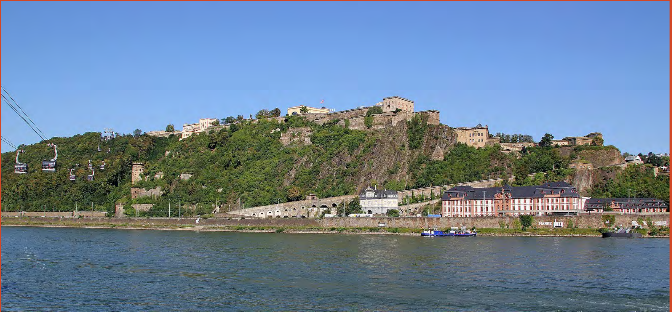
Die Festung Ehrenbreitstein in Koblenz