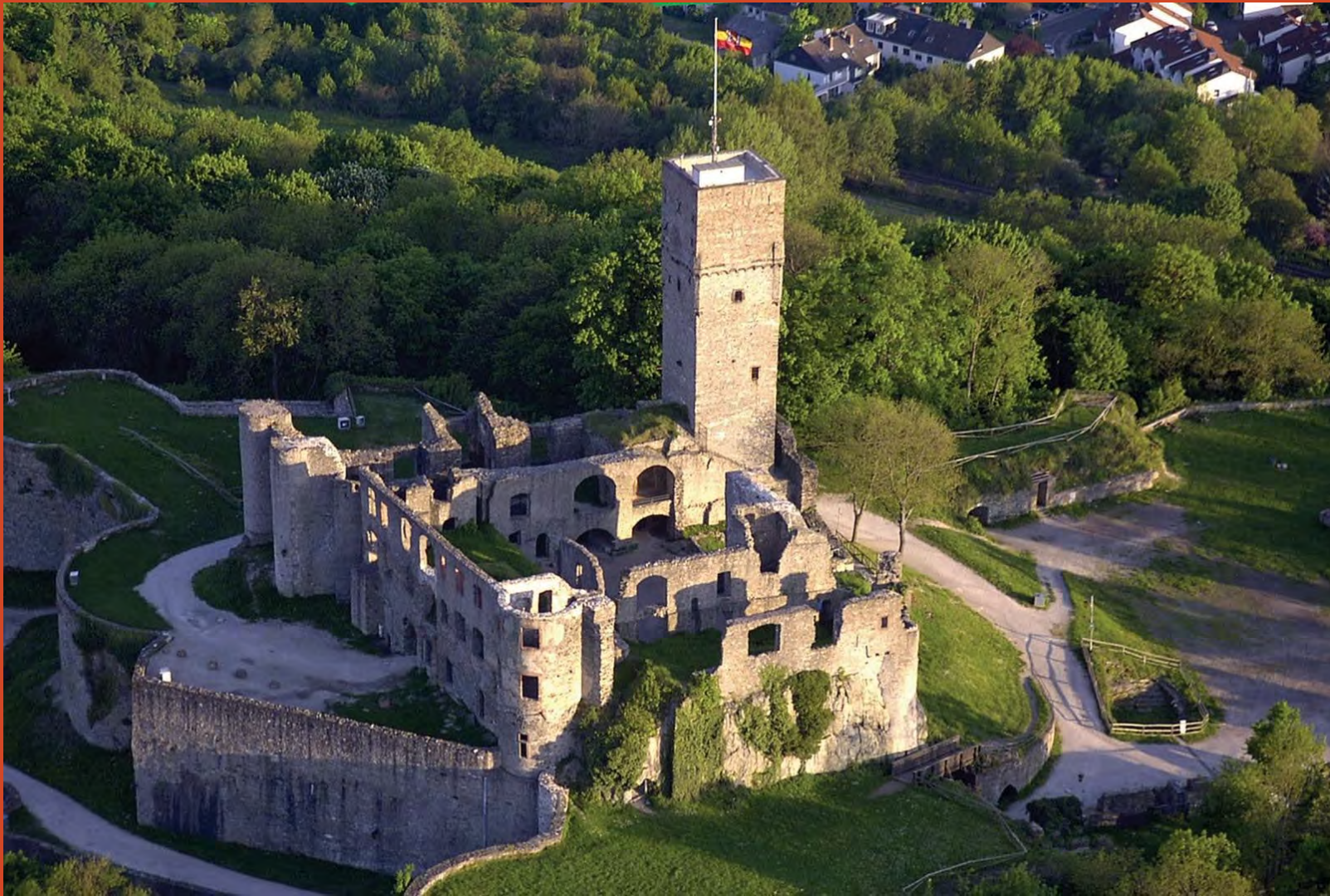
Festung Königstein 2022