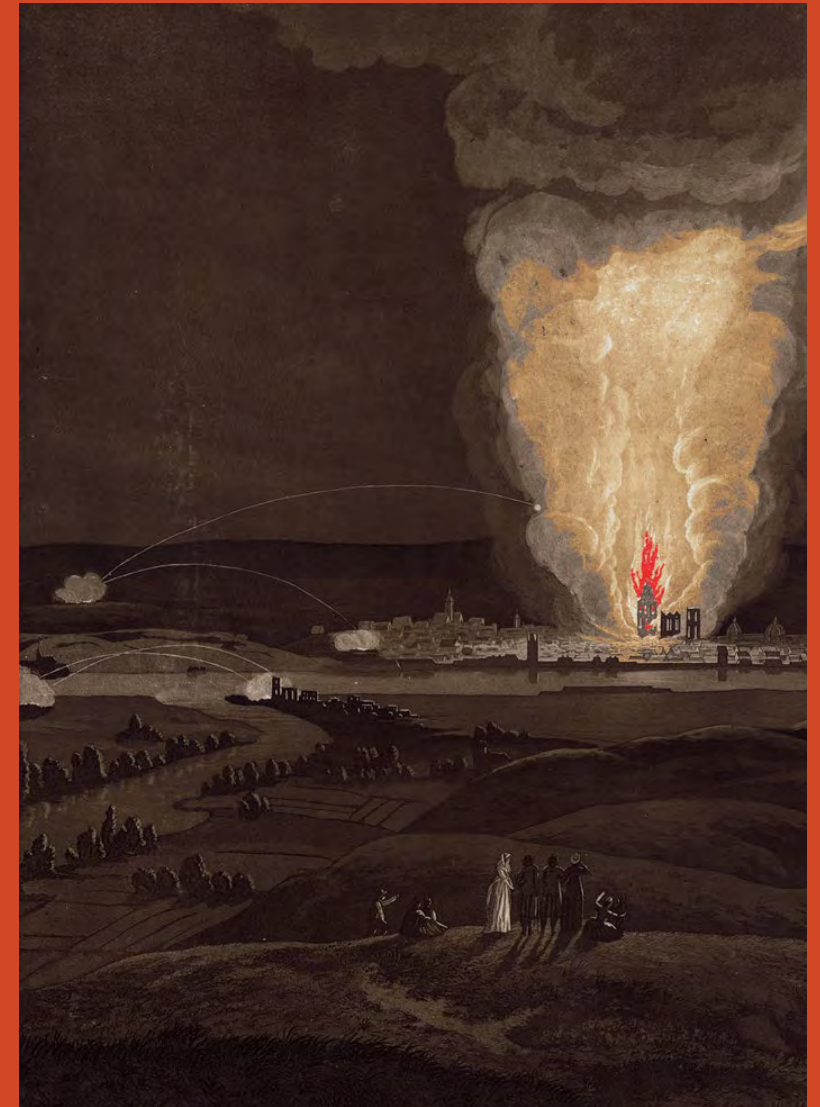
Bild des brennenden Mainz, Juli 1793