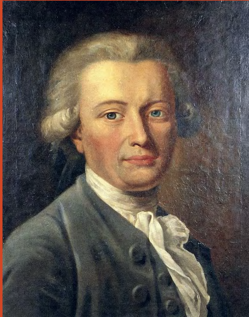
Einer der prominenten Mainzer Jakbiner Georg Forster, Gemälde von J. H. W. Tischbein