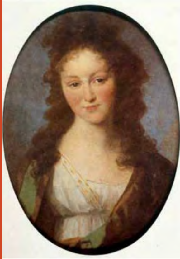
Caroline Böhmer (1763-1809), links