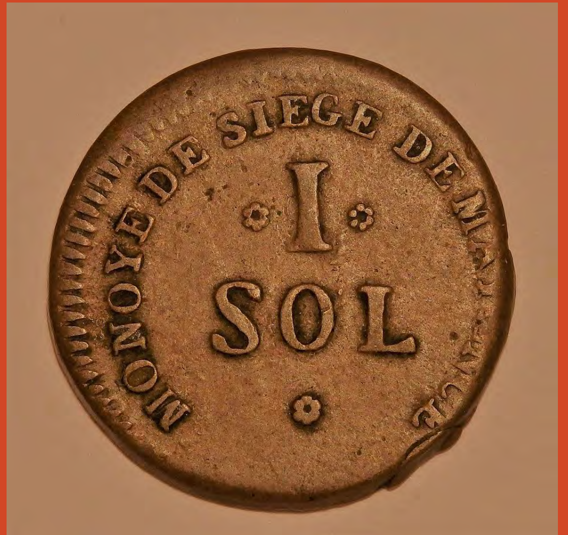
Münze der Mainzer Republik („Monoye de Sieges de Mayence“)